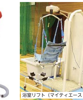
浴室リフト（マイティエースⅡ）

抱っこによる介助は限界があります。様々な福祉用具を小さいうちから活用することがとても大切。ぜひ、体験してみてください！