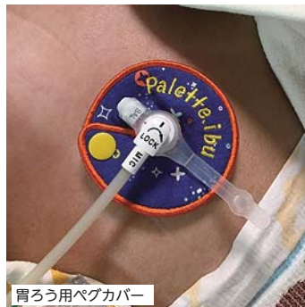
胃ろう用ベグカバー