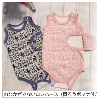
おなががでないロンパース（胃ろうポッケ付き）