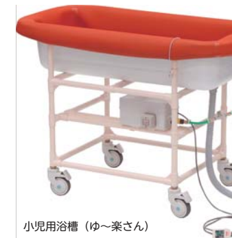
小児用浴槽（ゆ〜楽さん）